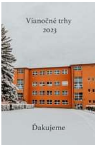
Pozdravov ZŠ bolo vytlačených 100 kusov pohľadnic