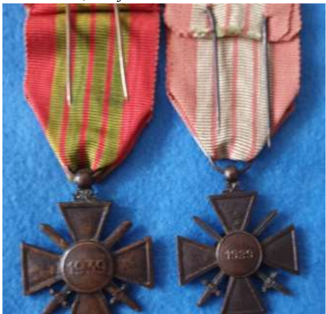
Dve exilové vydania, vľavo verzia zo severnej Afriky, vpravo z Milána. Vlastná zbierka

Rozhodnutím z dňa 7. Januára 1944, ktoré vydal Francúzsky výbor národného oslobodenia, bolo rozhodnuté, že jediným platným vojnovým krížom bude pôvodný Daladierov kríž s letopočtom 1939 na rube, takže bola zrušená okrem Vichystického kríža aj verzia Henriho Girauda.