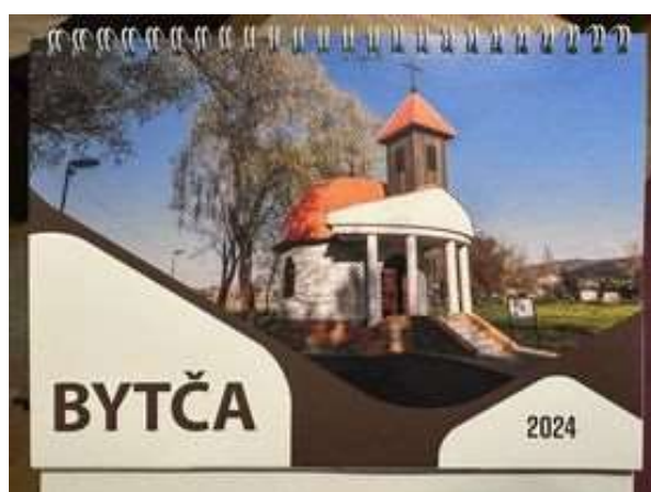
Fotograf Ján Rabara vytlačil 400 kusov stolných a 300 kusov malých vreckových kalendárov