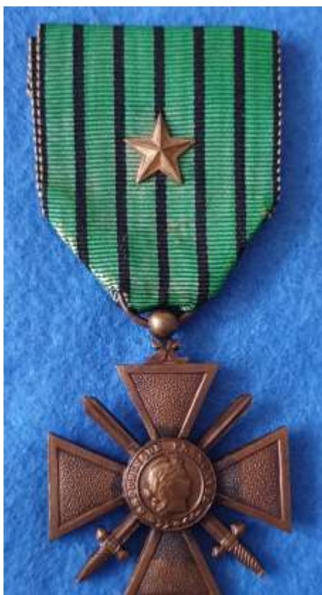
Vichystický kríž s letopočtom 1939-1940 Vlastná zbierka

Ďalším variantom vojnového kríža je veľmi vzácny kríž pre légii francúzskych dobrovoľníkov, ktorí bojovali na Východnom fronte.