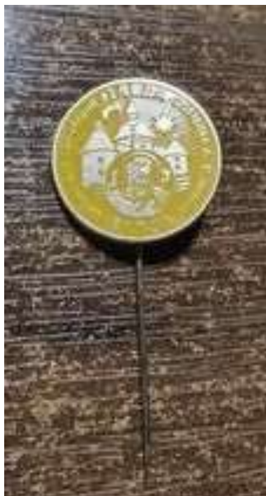
Občianske združenie Galza vydalo s podporou grantového fondu mesta Bytča odznak s certifikátom v počte 100 kusov. Odznak vyrobili v Mincovni Kremnica, štátny podnik. Kalendár vydal fotograf Ján Daniš v počte 6 kusov. Námetom boli Mala Fatra, Západné Tatry a Vysoké Tatry.